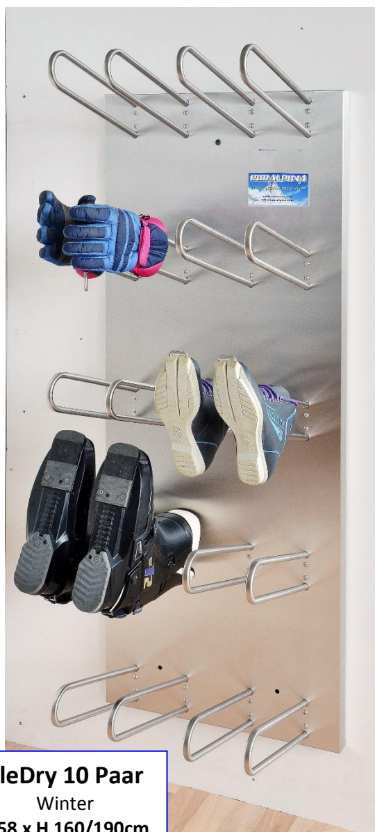
EleDry 10 Paar Winter B 58 x H 160/190cm T 38/48cm

In den gebogenen Edelstahlrohren wird die Warmluft mit sehr hoher Geschwindigkeit über Düsen in die Schuhe, Stiefel oder Handschuhe geführt; dies gewährleistet eine schonende und rasche Trocknung.